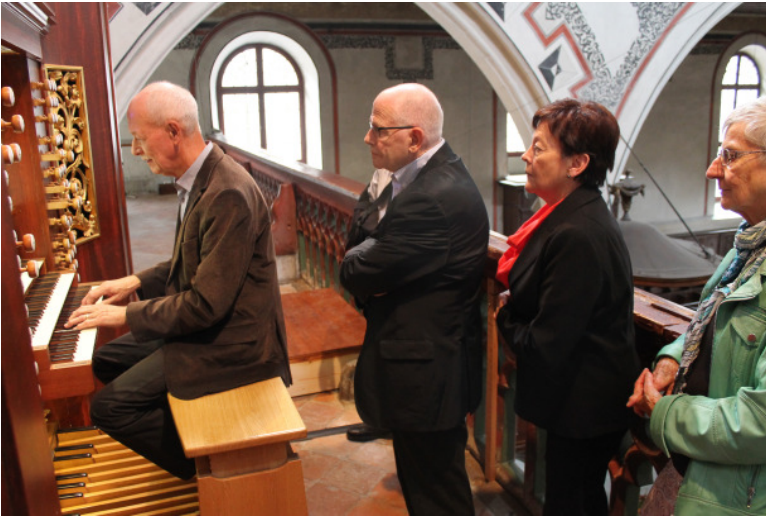
Eglise française réformée

Am späten Nachmittag traten wir zufrieden und bereichert vom musikalischen Erlebnis die Heimreise an.